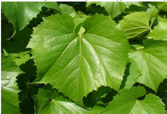
Foto n. 3. Foglia adulta su pianta (Rappresentare le tipologie prevalenti).

Il Ministro dell'agricoltura, della sovranità alimentare e delle foreste