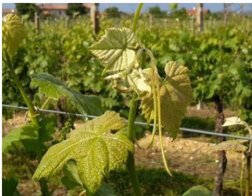
Foto n. 2. Foglia adulta.

Foto n. 1. Apice con foglioline apicali e 4° foglia.