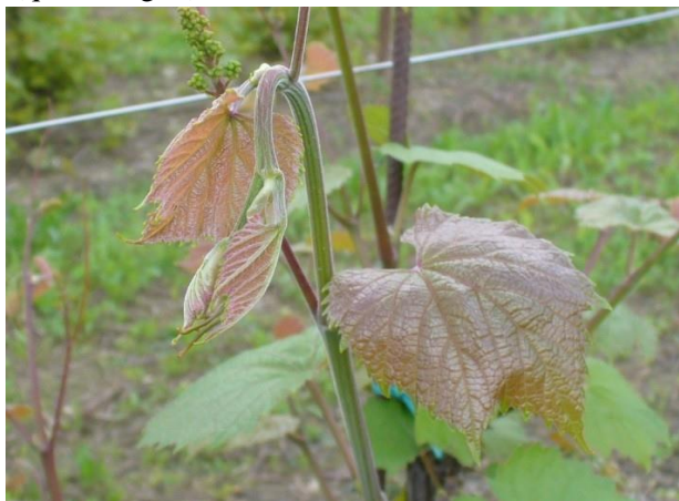
Foto n. 2. Particolare del tralcio erbaceo primaverile/estivo.

Foto n. 1. Pianta dopo il germogliamento con tralci lunghi dai 30 ai 70 cm, con particolare riferimento all'apice comprese le foglioline apicali e quelle basali (quarta foglia).