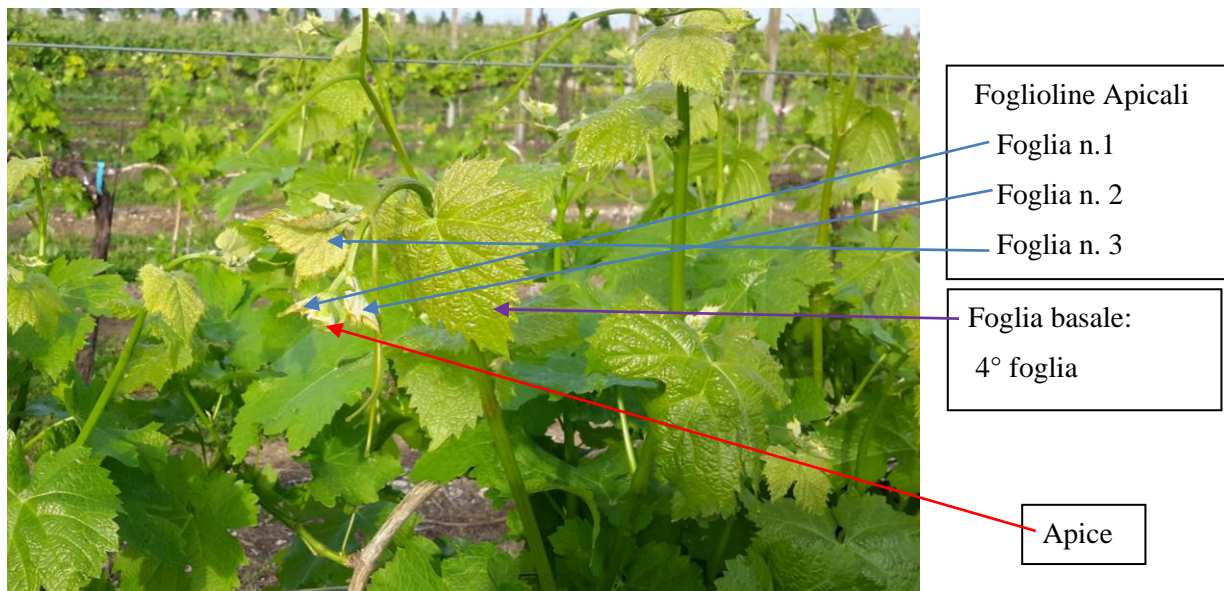
Foto n. 2. Apice e pagina superiore delle foglioline apicali e della foglia basale (4° foglia).

Foto necessaria ai fini dell'identificazione delle barbatelle.